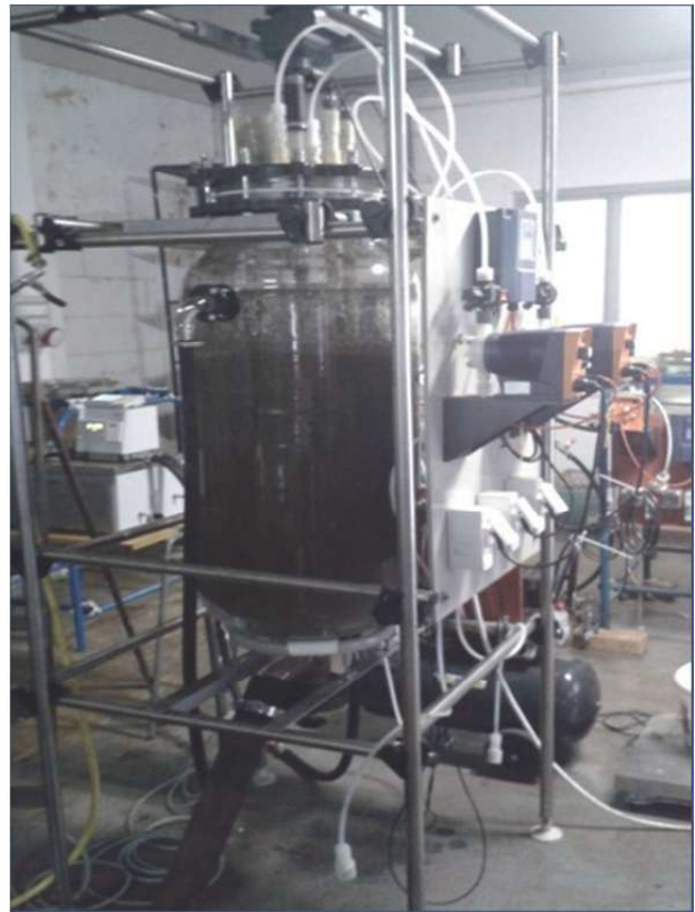
Obr. 3 Systém automatickej regulácie pH (vľavo) a lúhovací reaktor (vpravo) Fig. 3 Automatic pH control system (left) and leaching reactor (right)