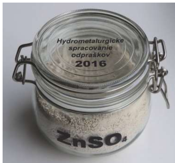
Obr. 2 Výsledné produkty pilotnej poloprevádzkovej linky LSPO: oxid zinočnatý (hore), síran zinočnatý (dole)